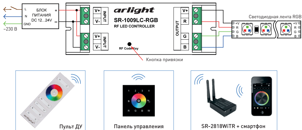
Рис. 2. Схема подключения оборудования на примере контроллера SR-1009LC-RGB.